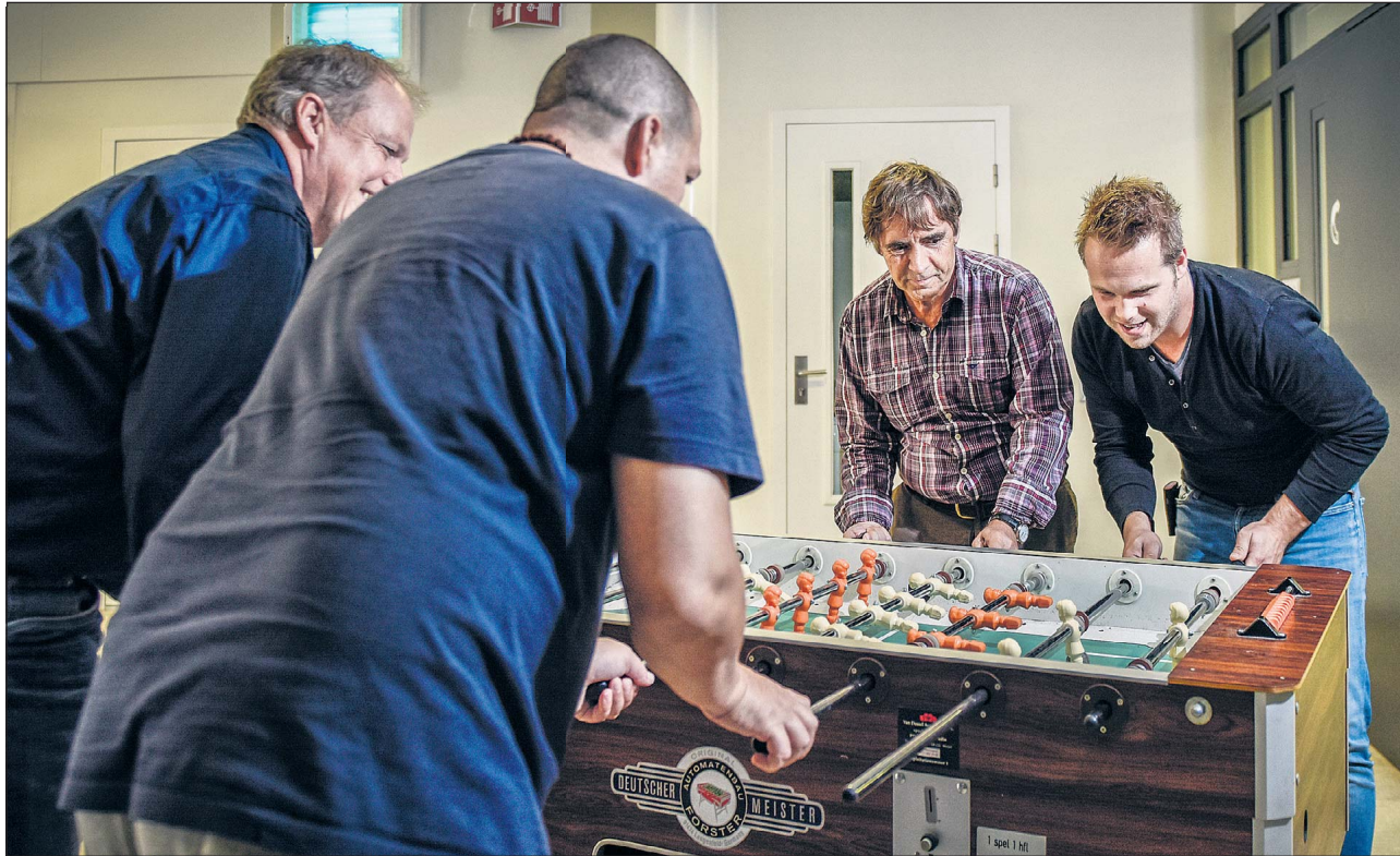
Een buddy kan net dat zetje in de goede richting geven naar resocialisatie.